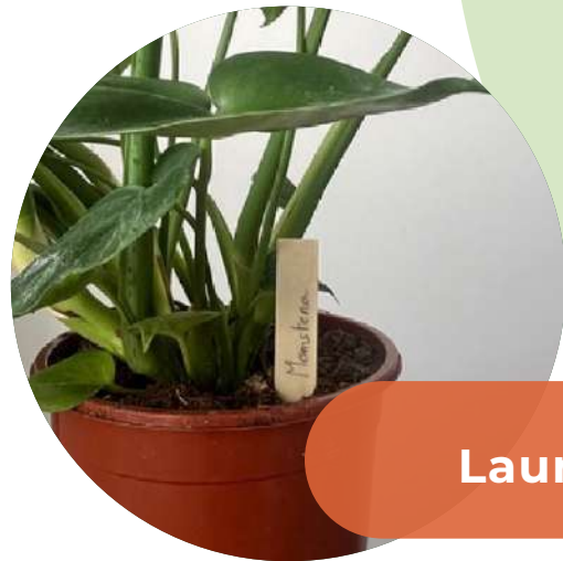
Laurène, 29 ans

“Les piquets sont très utiles, et faciles à utiliser. Je trouve pratique le fait qu’ils soient effaçables, pour s’adapter aux changements de plantes selon les saisons. “